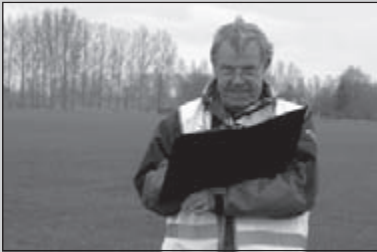
10 jaar Clubkampioenschap